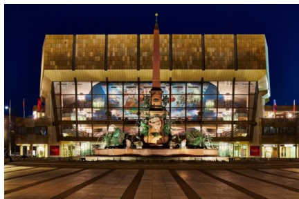
Gewandhaus zu Leipzig