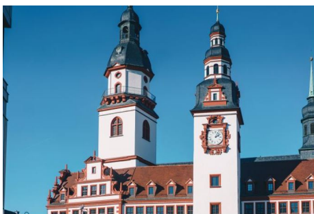
Rathaus in Chemnitz