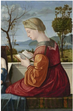
Vittore Carpaccio, Martyrium des heiligen Stephanus 1520, Staatsgalerie Stuttgart.