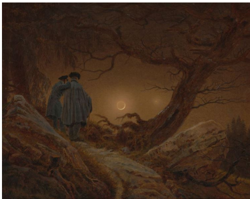
Caspar David Friedrich, Zwei Männer in Betrachtung des Mondes, 1819/20 Öl auf Leinwand, 34,5 x 44 cm

Caspar David Friedrich. Wo alles begann. Fahrt zu den Sonderausstellungen nach Dresden mit Besuch der Operauf-führung „La Traviata“ in der Semperoper vom 08.11. – 10.11.2024