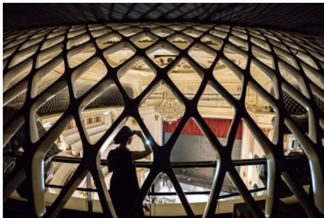
Staatsoper Unter den Linden, Hinter der Nachhallgalerie