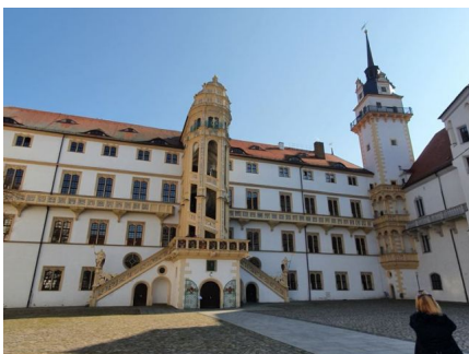
Schloss Hartenfels in Torgau.