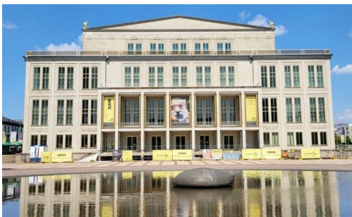
Oper Leipzig